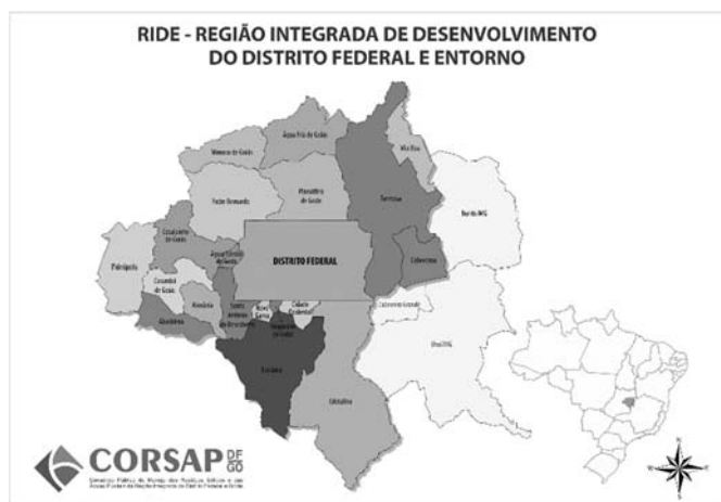
(Figura ampliada na página 13)

Levando-se em consideração o mapa da Região Integrada de Desenvolvimento do Distrito Federal e do Entorno (RIDE/DF), assinale a alternativa correta.