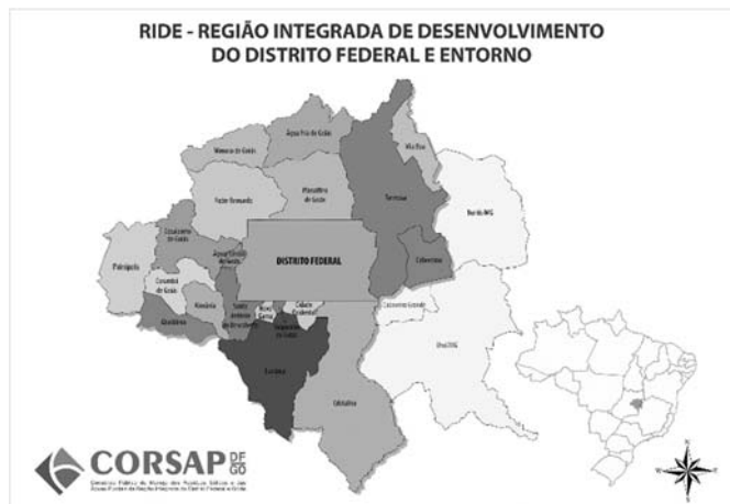
(Figura ampliada na página 13)

Levando-se em consideração o mapa da Região Integrada de Desenvolvimento do Distrito Federal e do Entorno (RIDE/DF), assinale a alternativa correta.