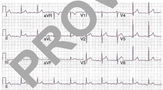
ECG de 12 derivações.