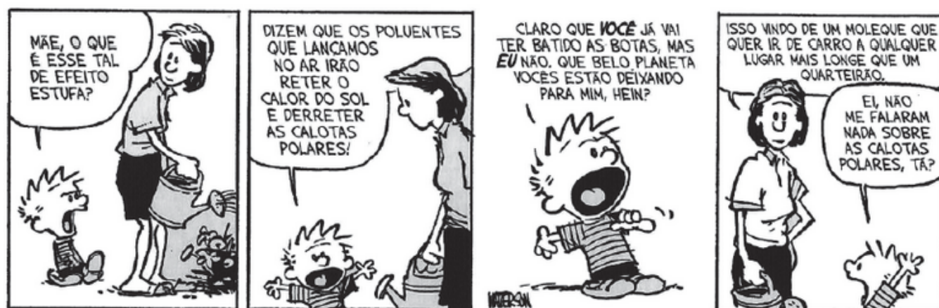
Figura Ampliada do texto 3