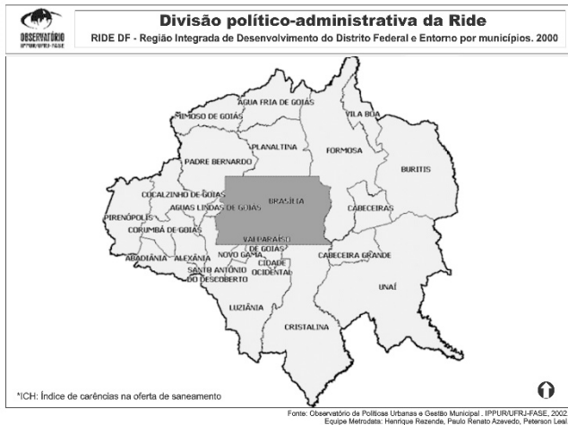
(Figura ampliada na página 14)

O mapa apresentado permite que se reconheça a complexidade da movimentação populacional dentro da Região Integrada de Desenvolvimento do Distrito Federal e Entorno (RIDE/DF). São vários municípios com uma população total de aproximadamente 3,8 milhões de pessoas e que apresentam especificidades, como problemas de mobilidade urbana. Acerca desse tema e considerando a disposição do mapa, assinale a alternativa correta.